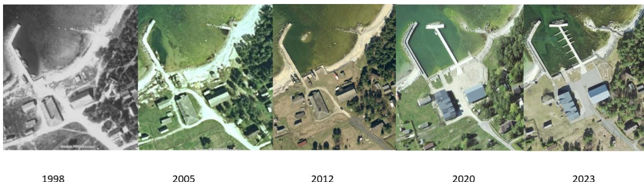
Joonis 3: Muutused rannajoones 1998 aasta kuni 2023 aasta Maa-ameti ajalooliste ortofotode andmetel.

märgata mõningat kulutust, eriti näiteks aastal 2020, kui oli erakordselt soe talv 36 . Olukorra stabiliseerimiseks on rannaala kividega kindlustatud. Seega võib täheldada sadamarajatiste mõju, kuid rannaprotsessid ei ole oluliselt muutunud teise kai rajamisel või sõltuvalt süvendustöödest.