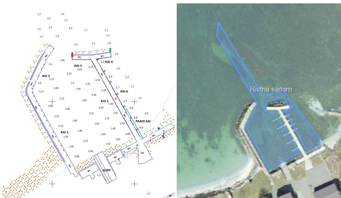
Joonis 2. Ristna sadama sügavusmoodistused (vasakul) ja süvendusala (paremal).

Prognoositav sadama hooldustööde intervall on 5-10 a. Seega, teostatakse keskkonnanaloo kehtivuse perioodil süvendustöid 1-2 korda. Kuna töid plaanitakse projektipõhiselt kaasates Ettevõtluse Arendamise Sihtasutuse (EAS), Keskkonnainvesteeringute Keskus SA (KIK) või Põllumajanduse Registrite ja Informatsiooni Ameti (PRIA) toetusi, ei ole võimalik ennustada, kas üldse ja mis aastal töid teostatakse. Küll on vajalik taotluse esitamisel kehtiv keskkonnanaluba.