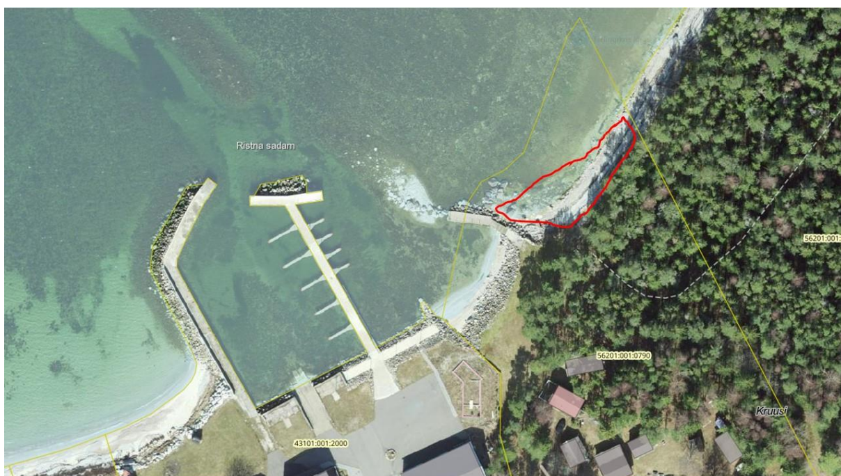
Joonis 6. Punasega märgitud pinnase paigutamise ala sadamast idas.

Seega lähtuvalt olemasolevast olukorrast peaks suurema koguse süvenduspinnase paigutamiseks eelistama pinnase paigutamist Kruusi kinnistu rannaalale (vt joonis 6) sealse erosiooni leevendamiseks. Pinnast võib otse rannaalale pumbata või transportida veokiga. Pinnase paigutamist teostada madala veega ajal. Sadamapoolses osas võib veokiga vedades pinnase paigutada rannale ja pagurannale kuni 10 m tänasest rannajoonest merepoole (see on ala mis erodeeritud viimase ca 20 aastaga). Kihi paksus võib olla isegi suurem kui maapoolne vall. Pumpamise meetodit kasutades on lubatud pulp pumbata ranna peale, hiljem vajadusel on võimalik materjal rannale ja pagurannale laiali planeerida.