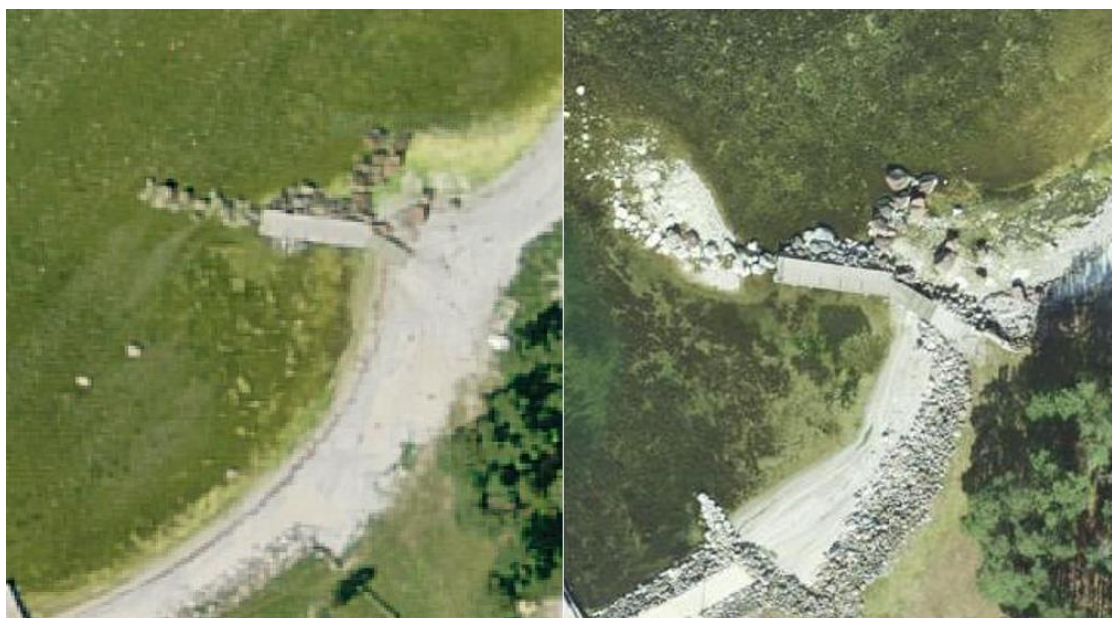
Joonis 4. Sadamast idas olev Kruusi kinnistu rannaala 2014 aastal (vasakul) ja 2023 aastal (paremal) Maa-ameti ajalooliste ortofotode andmetel.

Lisaks on Kruusi kinnistu rannaalalt, pagurannalt ja kaldavööndist lükatud kokku kivid, väiksem paadisild koos vundamendi, pealesõidutee ja platvormiga (vt joonis 4). Sellise kivide ümberpaigutamine võib kaasa aidata veerežiimi muutustele. Kivide eemaldamine suuremal alal madalast veest võib mõjuda oluliselt lainetuse intensiivsust, lainetuse jõudmist rannale, setete liikumist ja jääruisi liikumist. Vee kiirus ja purustusjõud ning liikumine rannikule muutub ka siis, kui kivide asukohta oluliselt muuta. Kividega vöönd vees kaitseb randa laine eest ja on võimeline selle ära murdma. Vahetult rannajoonel kivide funktsioon mõnevõrra muutub. Tugevate tormide korral lööb laine otse randa kindlustama paigutatud kividele, laine põrkab vastu kivekaitset ja kiirendab liiva ärajuhtimist. Rannikueksperdi 37 arvamuse kohaselt on iga kivi, mis madalas meres lainet murrab oluline ranna kaitse seisukohast.