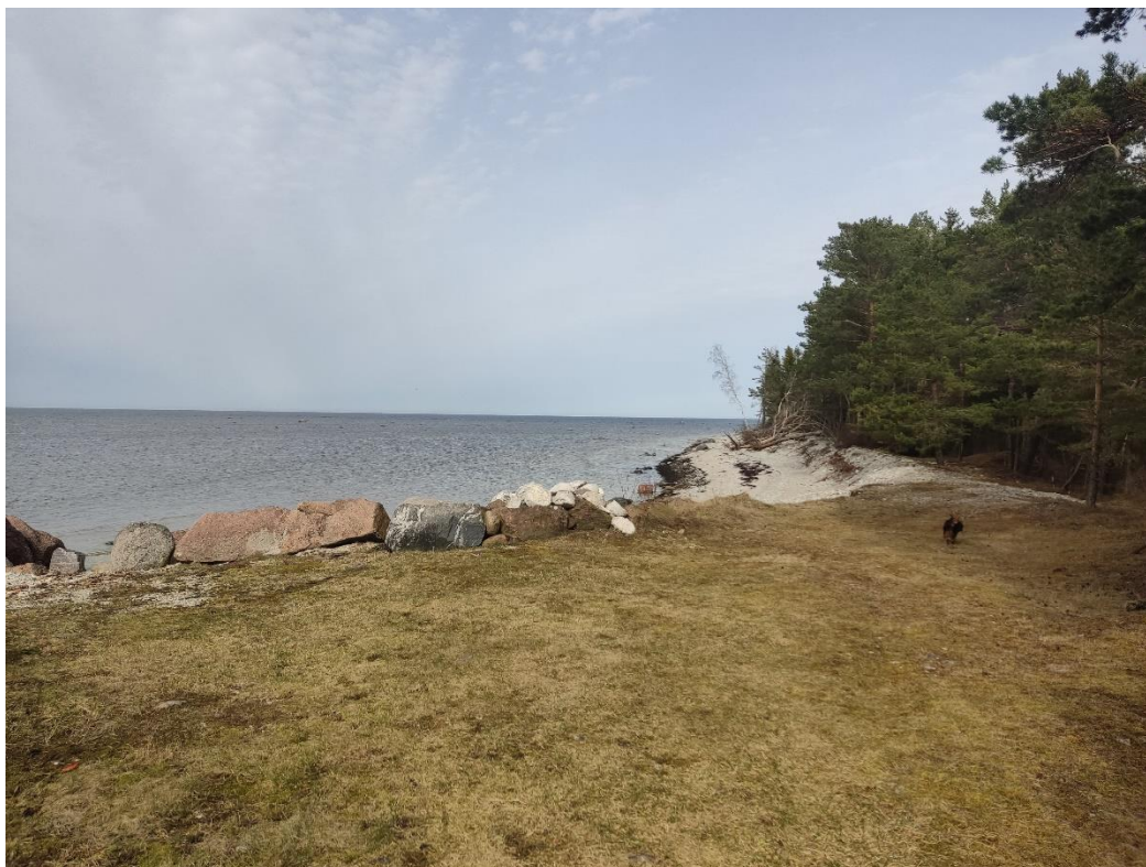
Joonis 5. Sadamast idasse jääv rannaala (Kruusi kinnist kü 56201:001:0790), eespool kindlustatud osa ning eemal erodeerinud rannaosa.

Erinevate faktorite tulemusena on nähtav erosioon Kruusi kinnist (kü 56201:001:0790) rannaalal (joonis 5).